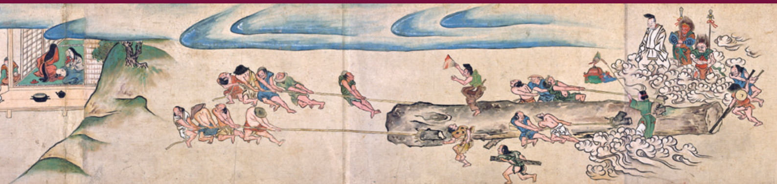
Hasedera engi emaki, scroll I, section 12. Muromachi period. Handscroll, ink and colors on paper. H 30.8 cm. Margaret E. Fuller Purchase Fund. Gift to a City: Masterworks from the Eugene Fuller Memorial Collection in the Seattle Art Museum.

このシンポジウムは、九州大学・世界トップレベル研究者招へいプログラム(Progress100:人社系学際融合リサーチハブ形成型)の一環として開催するものです。