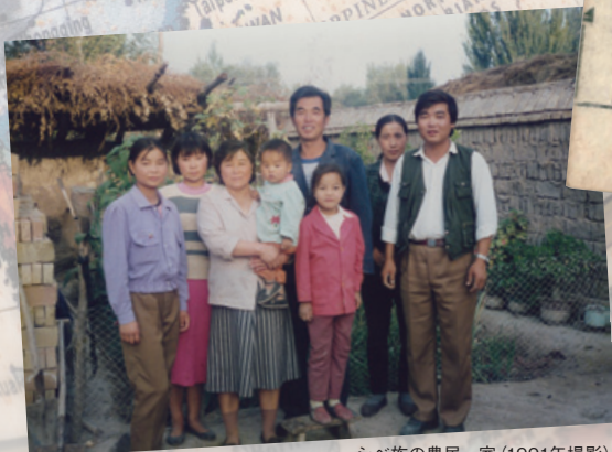
シベ族の農民一家(1991年撮影)