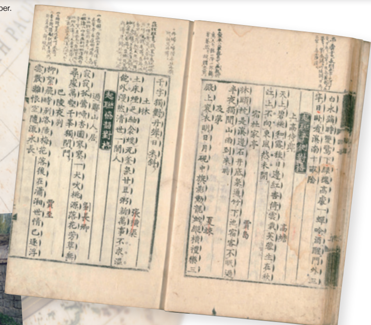
朝鮮版「聯珠詩格」(国会図書館蔵)